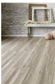
□グレイジュエルムF (さらっとFootfeel)