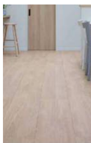
□テンダーオークF (ほんのりFootfeel)