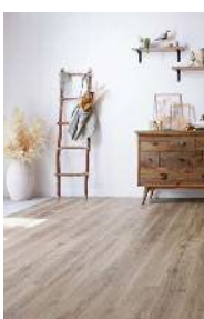
□ラフオークF (しっかりFootfeel)