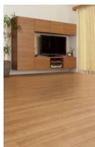
□メイプルF (さらっとFootfeel)