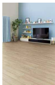
□チェスナットF (しっかりFootfeel)