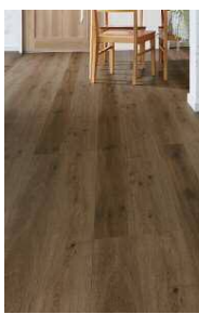
□ナチュラルオークF (ほんのりFootfeel)