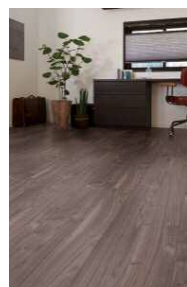
□ウォールナットF (ほんのりFootfeel)