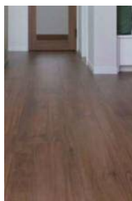
□カムチークF (ほんのりFootfeel)