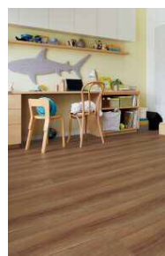
□チェリーF (さらっとFootfeel)