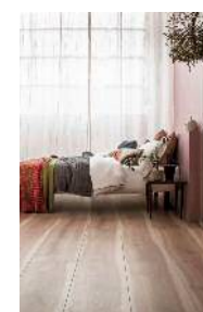
□ワイドローズチェリーF (さらっとFootfeel)