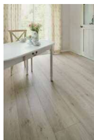
□ホワイトオークF (ほんのりFootfeel)