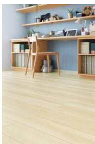
□イタリアンウォールナットF (ほんのりFootfeel)